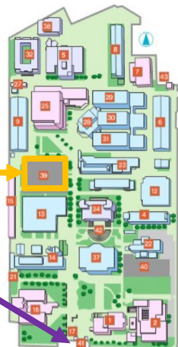
津田沼キャンスマップ