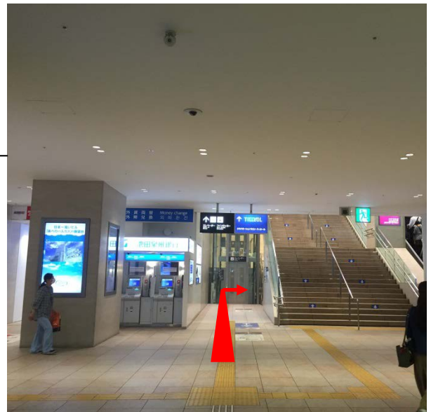
地下 1F 会議室へのルート案内

(地下 1F コンコースにて階段横の通路に入り、エレベーター前を右折、奥の通路に進む)