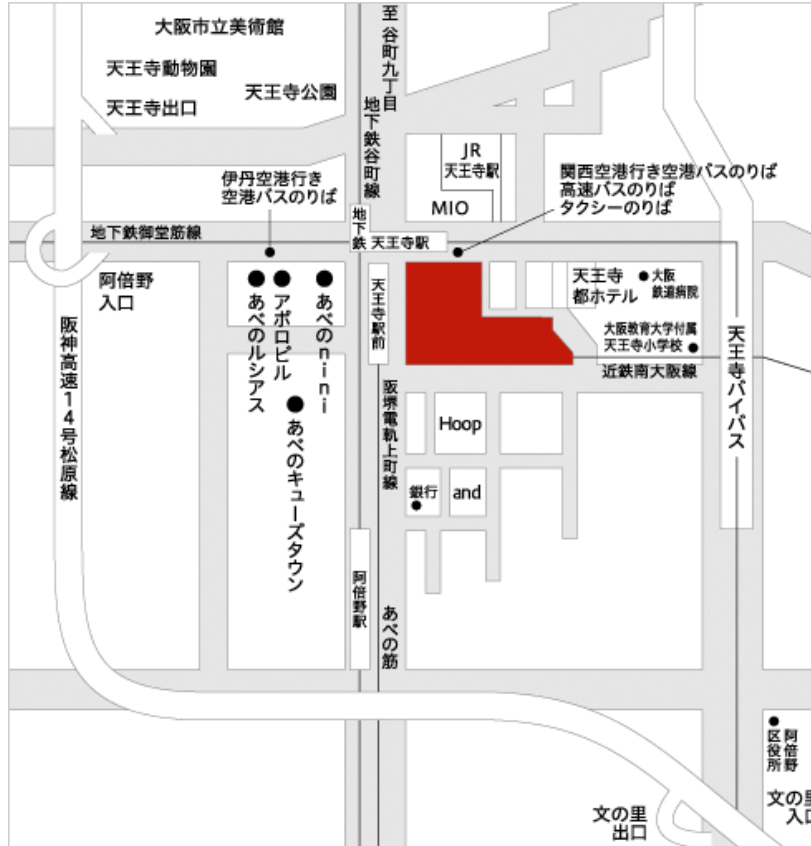
あべのハルカス案内

〒545-6016 大阪市阿倍野区阿倍野筋 1-1-43 あべのハルカス 地下 1F 会議室