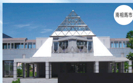
テクノアカデミー浜