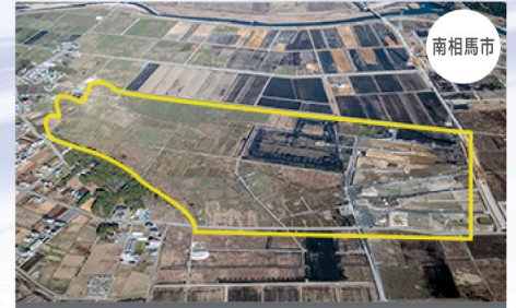
南相馬市復興工業団地