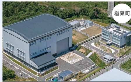
楡葉遠隔技術開発センター