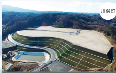
川俣西部工業団地