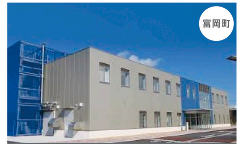
廃炉国際共同研究センター