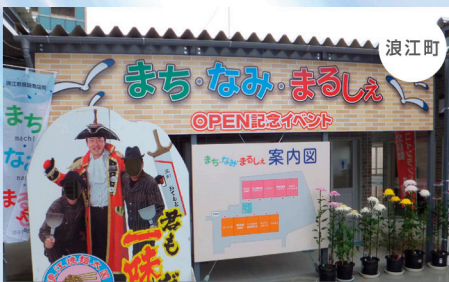
まち・なみ・まるしえ