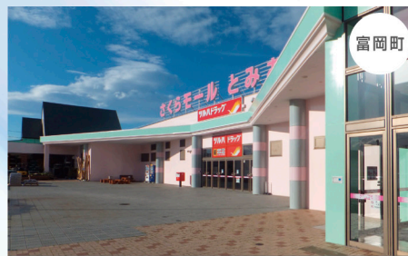
さくらモールとみおか