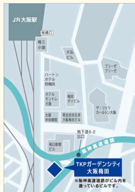
〈TKPガーデンシティ大阪梅田周辺 MAP〉 JR大阪駅から徒歩8分

(主催) 一般財団法人福島イノベーション・コースト構想推進機構、福島県 (共催) 経済産業省 (後援(予定)) いわき市、相馬市、田村市、南相馬市、川俣町、広野町、楡葉町、富岡町、川内村、大熊町、双葉町、浪江町、葛尾村、新地町、飯館村、公益社団法人福島相双復興推進機構、独立行政法人中小企業基盤整備機構近畿本部、公益社団法人関西経済連合会、大阪府商工会議所連合会、大阪商工会議所、大阪府商工会連合会、株式会社東邦銀行、NPO法人ロボットビジネス支援機構