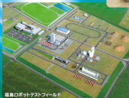
福島ロボットテストフィールド