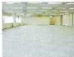
写真は一体利用時です。