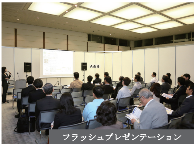
フラッシュプレゼンテーション