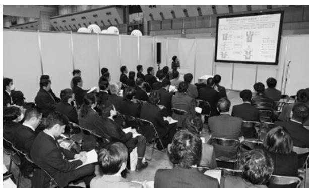
写真-6 製品技術説明会

展示会場内A・B・Cルームにおいて全47セッションの各社の製品技術説明が行なわれた。参加者延べ人数：2,107名 (写真-6)。