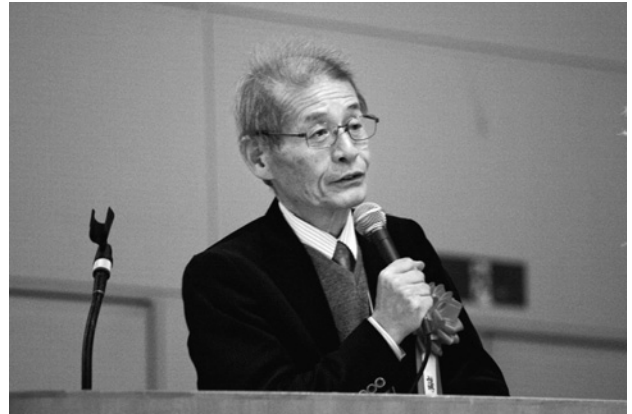
写真-4 特別講演 吉野 彰氏

た。リチウムイオン電池車の今後の一層の普及には電池本体のコストダウンは欠かせないが、1回の充電で走れる距離を延ばすために電池は大容量、割高になる。しかし、走行中に何度でも充電できる「ワイヤレス電源供給」の充電システムが進歩すれば大容量の電池は必要なくなり大幅にコストは下げられるとの指摘は新鮮な視点であった（写真-4）。