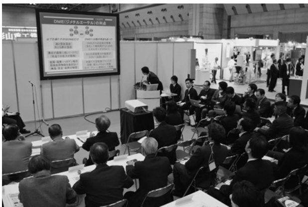
写真-8 アカデミックコーナー