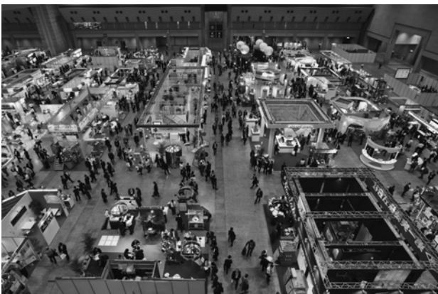
写真-1 東京ビッグサイト

定番の「粉じん爆発情報セミナー」が2日に、「ナノ物質ばく露防止技術セミナー」が3日に開催