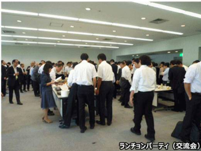
ランチョンパーティ (交流会)

Q.発表されたシーズに対する感想 (APPIE 産学官 2013 参加者当日アンケートより)