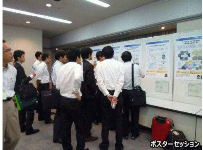
ポスターセッション