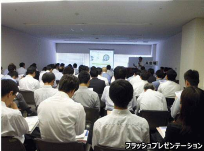
フラッシュプレゼンテーション